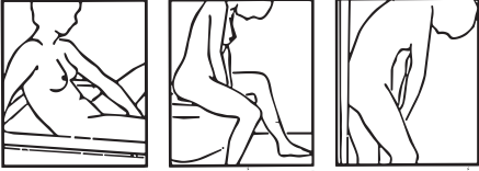
١. أثناء الاستخدام ٢. على الرض أو البديه ٣. في مغطس الحمام

حدي طريقة الاستخدام الأسهل بالنسبة لك. يجب أن تكوني في وضع مريح وغير ضيق.