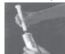
1-Pull plunger back to limit.

Remove cap from tube and screw into threaded open end of applicator.