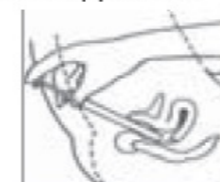
4-In a reclining position, gently insert vaginal applicator high into the vagina and depress plunger to deposit vaginal gel.