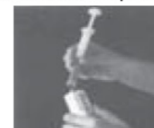
3-Detach filled applicator from tube.