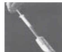
2-Fill applicator with vaginal gel by applying pressure to the bottom of tube, forcing the gel into the applicator barrel.